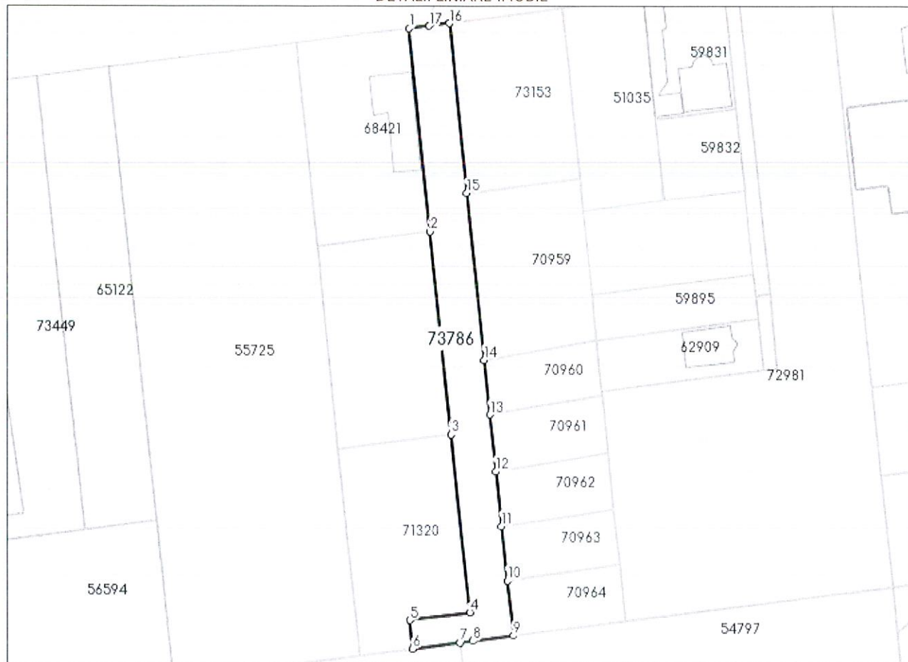
DETALII LINIARE IMOBIL

* Suprafața este determinată în planul de proiecție Stereo 70.